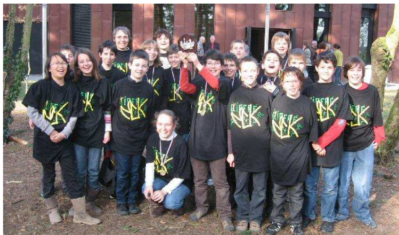
L'équipe du collège Martin Luther King de Liffré, sacrée championne académique en 2010 à Arradon (56).